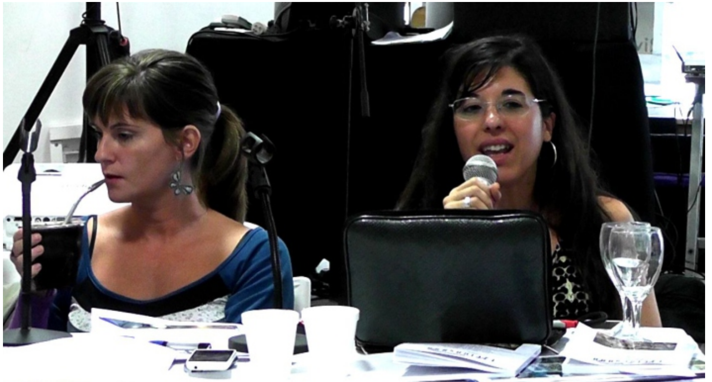
Plenario de Delegados 2015. Villa Mercedes, San Luis

En determinados momentos históricos las comisiones internas también se convirtieron en órganos fundamentales de la huelga general, lo que llevó a la clase trabajadora a mantener los mejores niveles de bienestar y conciencia social. Sin embargo, es necesario recordar que dicha situación generó reacciones ya no solo de las patronales y del poder económico, sino también del poder político a través de leyes prohibitivas, represión y en su más feroz afrenta, mediante dictaduras militares, siendo precisamente los delegados de base el blanco principal del terroris-