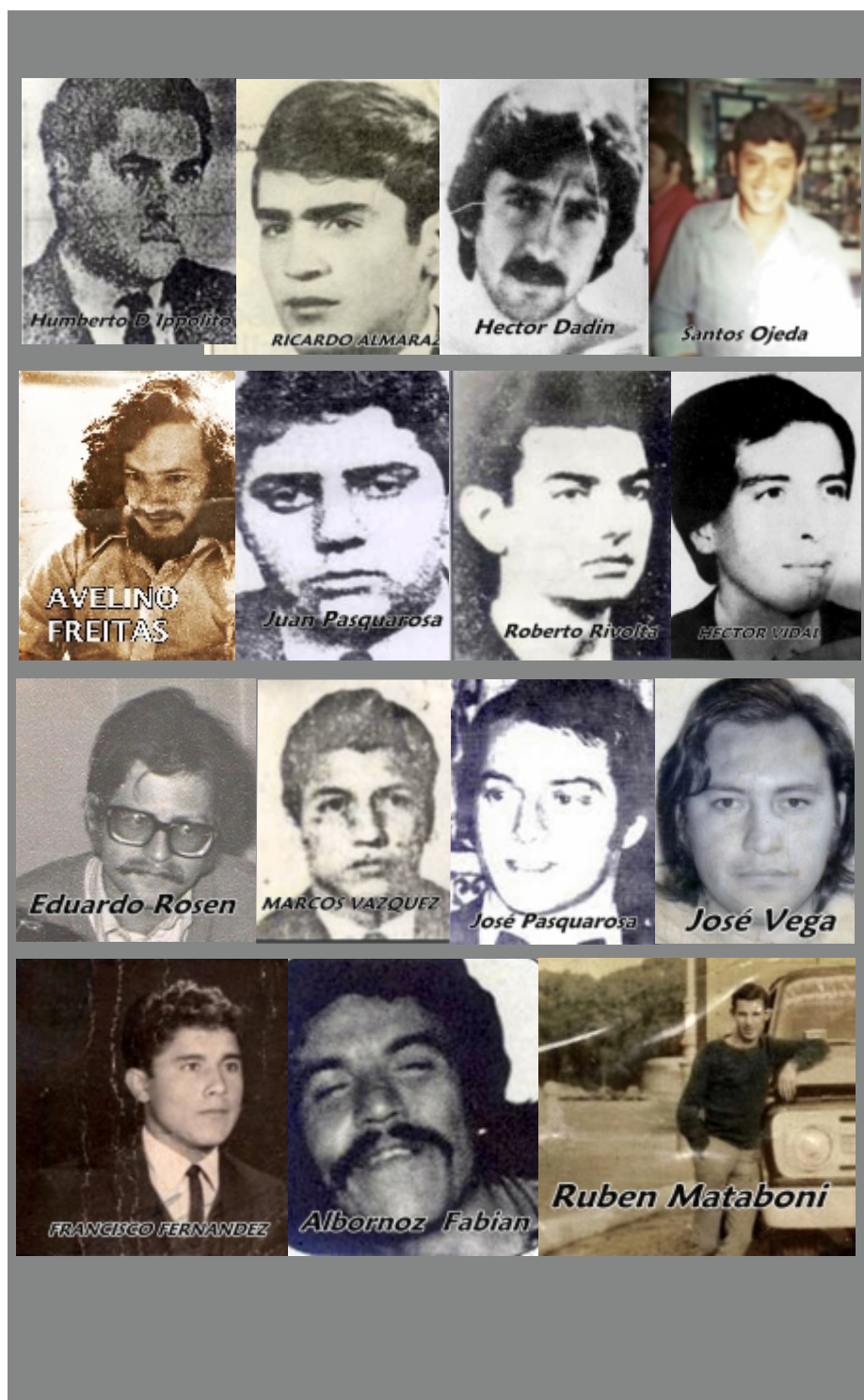
Fotos recuperadas de los compañeros desaparecidos

“Porque siempre está la ponderación de los mismos referentes en relación a la lucha de los derechos humanos, y dejan de lado a los compañeros de base. Y nosotros recuperamos eso también, la dimensión de su lucha. Porque yo me lamento porque perdí a mi viejo. Pero los obreros que sobrevivieron perdieron a todos los compañeros de la sección de laburo, perdieron a compañeros de militancia barrial, de la unidad básica, perdieron 15, 20 compañeros. Entonces eso es parte de nuestra lucha, reivindicar al compañero de base”.