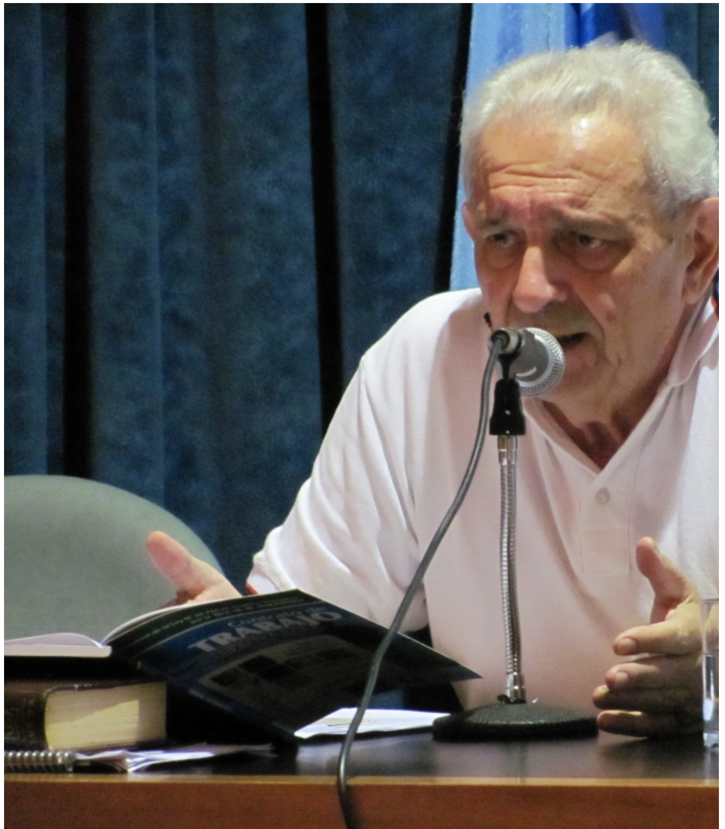
Foto: Primer Plenario de Delegados de la Federación el 3 de marzo de 2010

En abril de este año, ante la negativa patronal de otorgar aumentos sobre