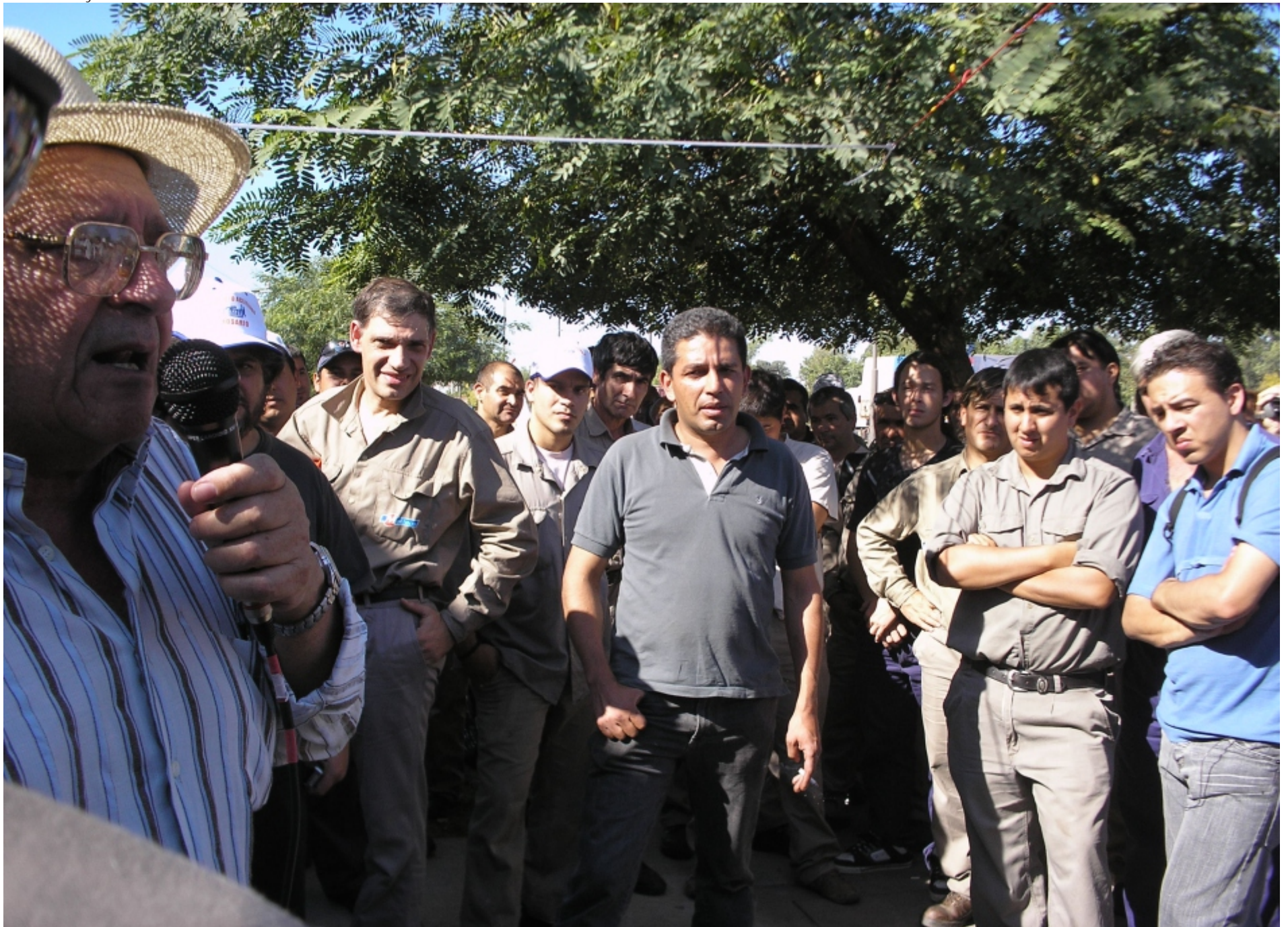
Foto: Paro y asamblea en Molinos Río de la Plata el Lunes 27 de abril de 2009

El salario mínimo vital es el piso del que deben arrancar las paritarias, así fue concebida su función y así debe ser recuperada, también así se recuperará el mercado interno. Lo demás es consolidar las consecuencias de la crisis de 2001.